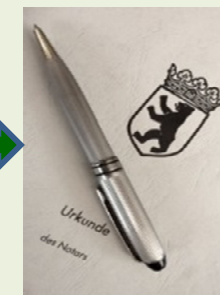
Notarielle Bestätigung der Teilgrundschuld