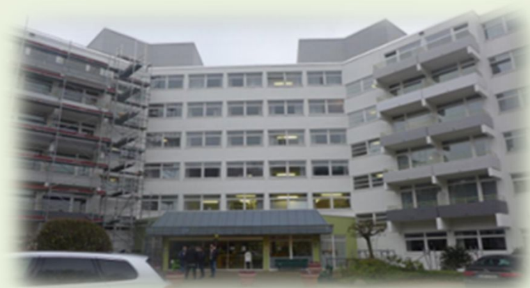
Reha-Klinikum „Bad Gandersheim“

Ein weiterer Geschäftszweig ist der Markt der Spezialimmobilien . Dazu gehören Pflegeheime und gewerbliche Objekte, die zusammen mit Partnerunternehmen weiter entwickelt werden.