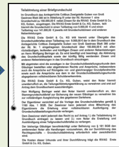
Abtretung der Grundschuld