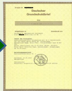
Grundschuldbrief im ersten Rang